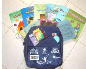
Contenu du cartable de CE1