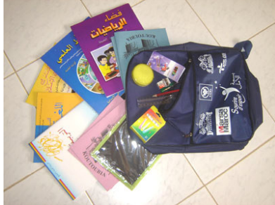
Contenu du cartable de CP