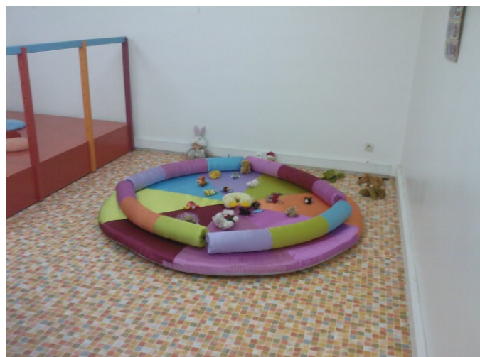
Espace enfants moins de 2 ans