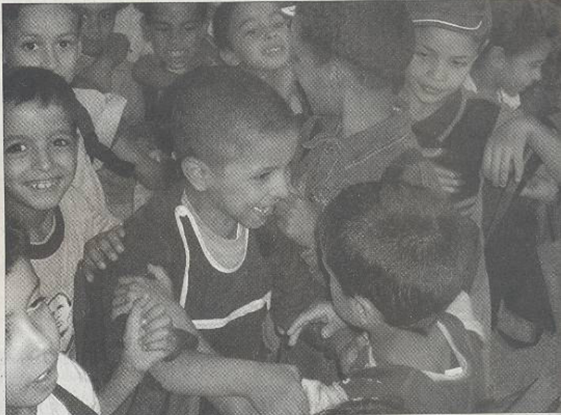
Pour l'année 2006, «Sourire d'espoir» a pour objectif de cibler 600 enfants de première, deuxième et troisième années du douar Oued Akreuch et Sidi Yahya Zaërs, et pour y arriver, l'association doit collecter près de 60.000 DH.